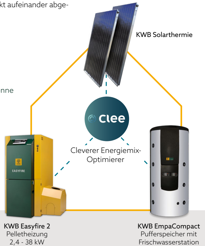
KWB Easyfire 2 Pelletheizung 2,4 - 38 kW